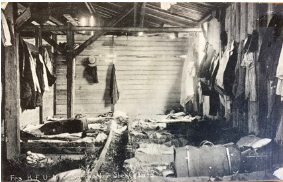
Postkort med motiv af sovesalen i træbarakken ved Steensgård, taget ca. 1915.

Ferieloven var langt fra opfundet i begyndelsen af det tyvende århundrede, men der var et stigende behov for udfoldelse i naturen på fridage, og fridage var søndage og helligdage. KFUM havde allerede fra starten haft ideen til afholdelse af sommerlejre for børn og unge. Der var tre afdelinger, hovedafdelingen - de ældre, ungdomsafdelingen og endelig yngsteafdelingen.