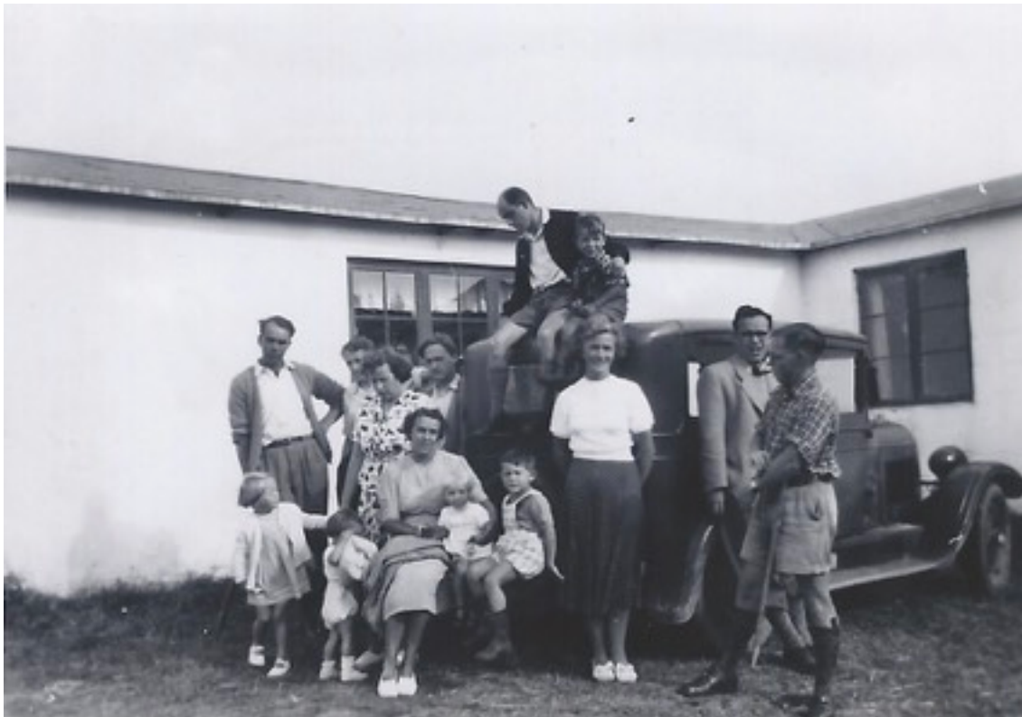
“Sommerlejren” omkring 1952 - privat foto.