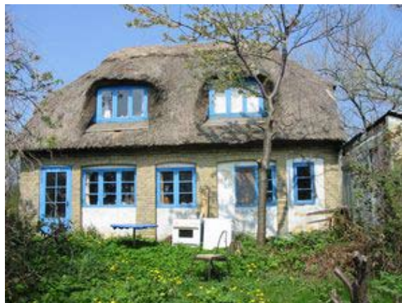
”Strandhytten” anno 2003