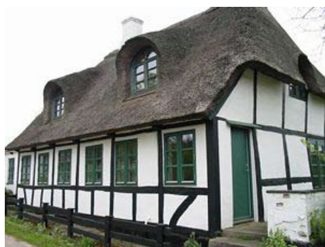
"Lærkenborg" anno 2003

I 1987 solgte jeg Østergade 48 og flyttede ned til Lohalsparken.