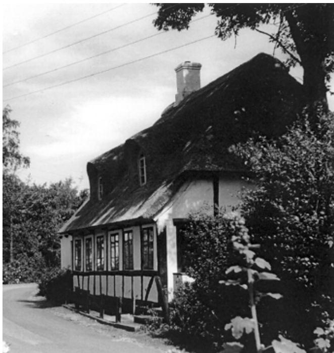
”Lærkenborg” Østerhusevej 19