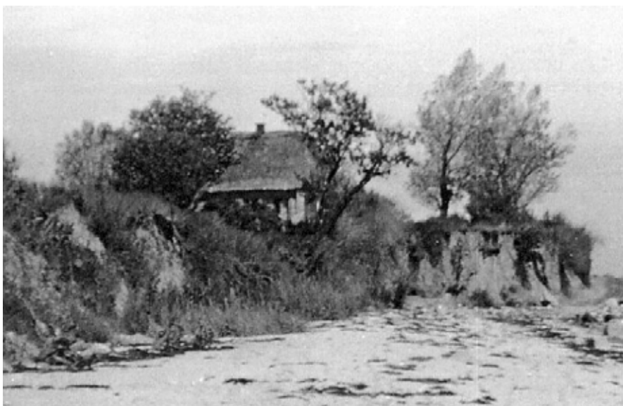
"Strandhytten" Østergade 38

Men det var lettere sagt end gjort at sælge pensionatet. Til sidst kom hun og spurgte os, men vi sagde nej, for vi var tilfredse med "Lærkenborg", som vi nu havde udvidet med 11 værelser ved køb af "Strandhytten" som annex til "Lærkenborg".