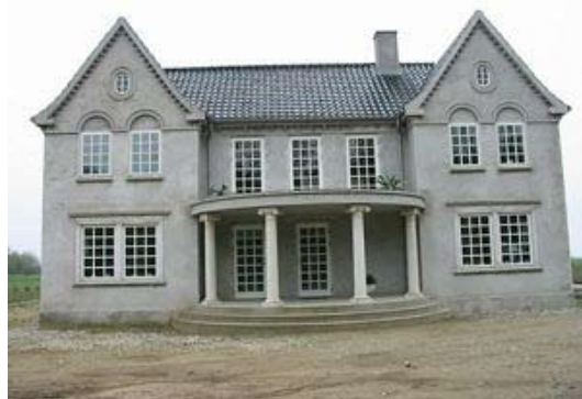
"Skindervænget" anno 2003