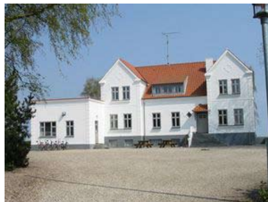
"Pension Langeland" anno 2003