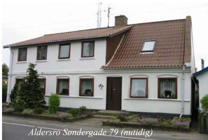
Aldersro Søndergade 79 (nutidig)