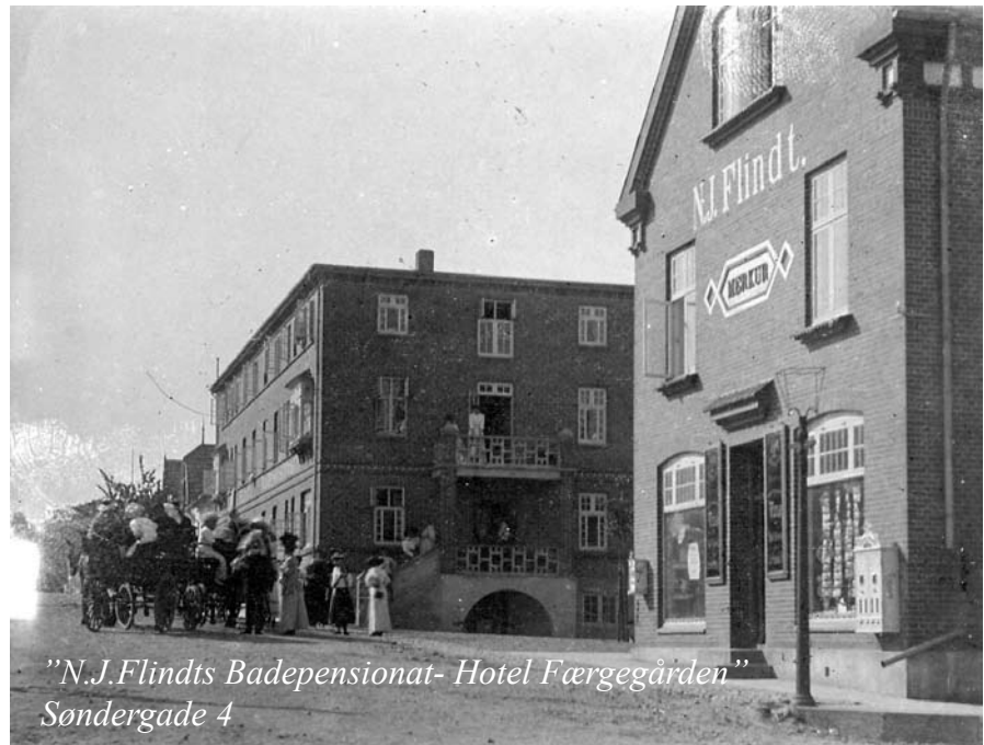
"N.J.Flindts Badepensionat- Hotel Færgegården" Søndergade 4