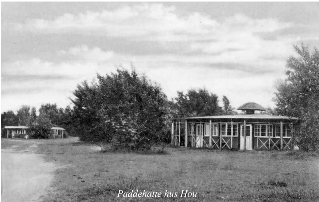
Paddehatte hus Hou