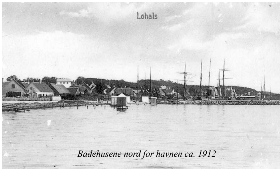
Badehusene nord for havnen ca. 1912

Ved stranden blev flere steder slået solide badebroer ud, yderst på broen var der et lukket badehus, hvor der ugenert kunne skiftes til datidens badedragter