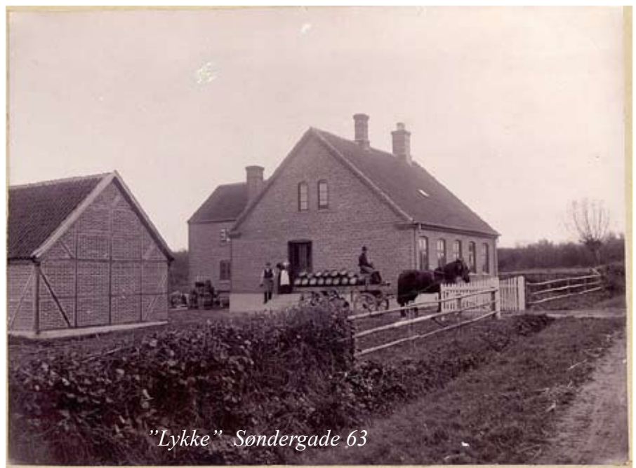
"Lykke" Søndergade 63