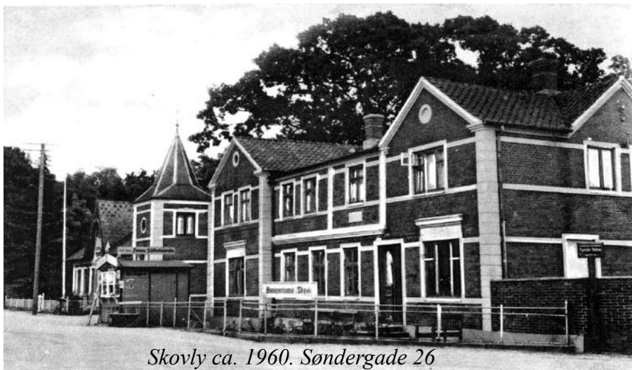
Skovly ca. 1960. Søndergade 26