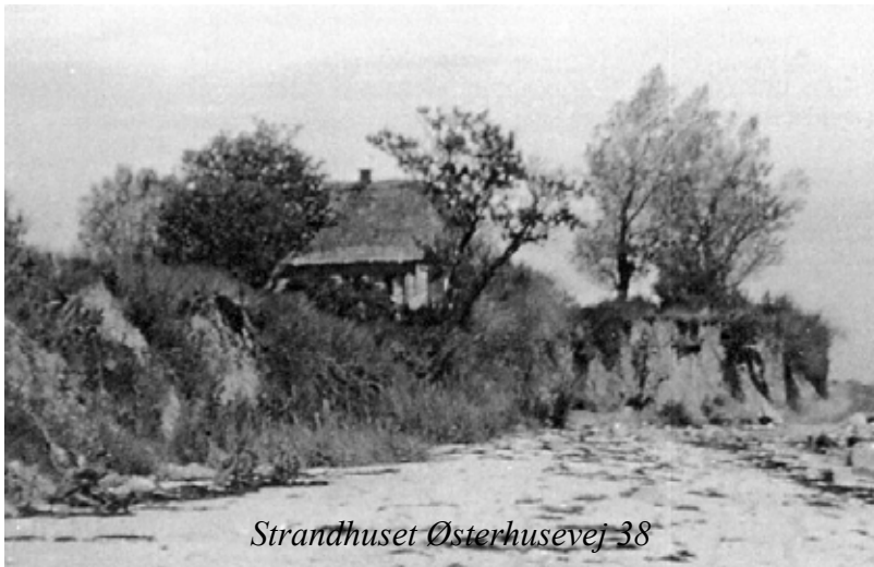
Strandhuset Østerhusevej 38

Der blev igen bygget til, og de købte det lille hus helt nede ved stranden, Østerhusevej 36, hermed hørte der anneks til Lærkenborg.