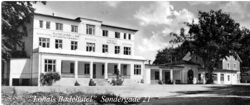
"Lohals Badehotel" Søndergade 21